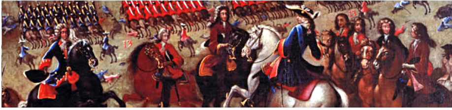
Quadre de la batalla d'Almansa pel pintor Ricardo Balaca (1862, Congrés dels Diputats)